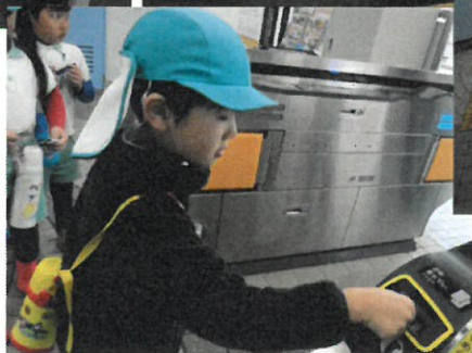
ゆっくり通る皆です。