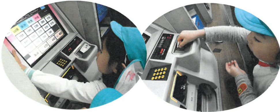
切符は自分たちで買ったよ♪