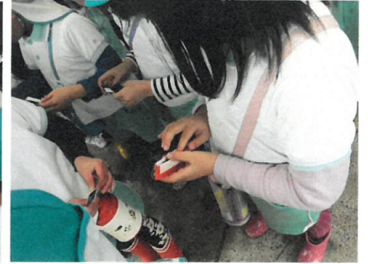
切符は朝に作った折り紙財布に入れて、落ちないようにポケットへ。