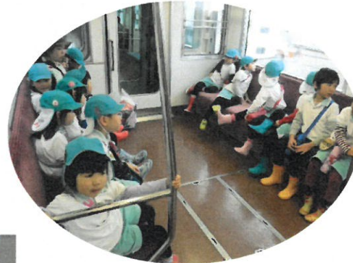
電車に乗って…《人丸前だね！》