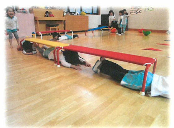
① このシーンを体感した子が、下の写真のように後ろ向きに通り始めました。後ろ向きはだめだよと止めようとした時...