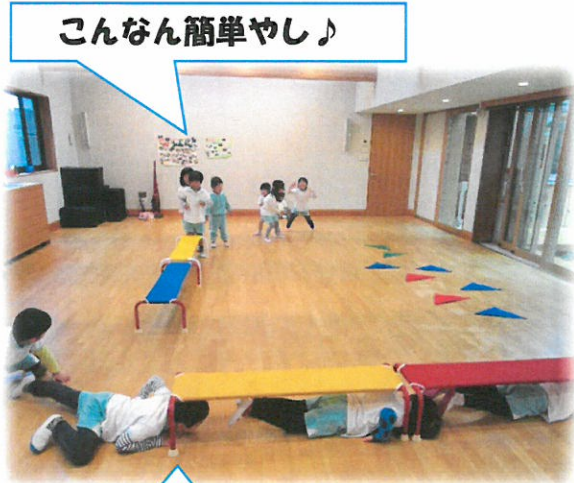
こんなん簡単やし♪