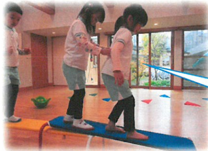
② このシーンを見た時先生は二人で乗るのは危ないと感じ止めようとしたが...