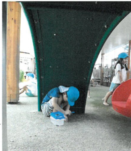
滑り台の下は 光が当たらず みやすいようです