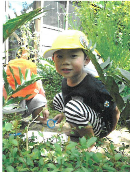
「みつけたよ～ここにいたよ！」 こすもすさんに教えてあげています。