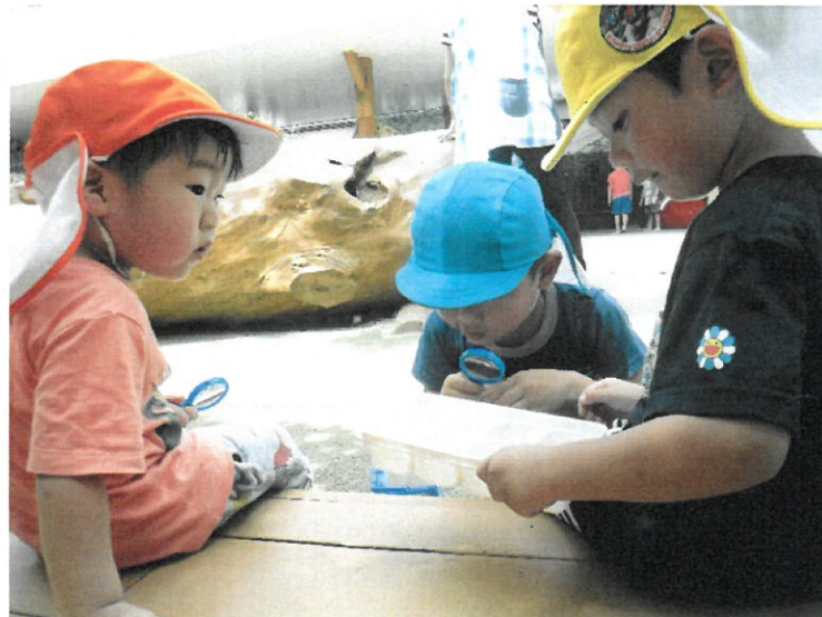
「おにいちゃんみせて」「ちょっと待ってね。」 異年齢での関わりも♪